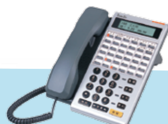
DK6-36DCB(BL) 36K 中文背光/藍芽耳機 DK6-36DC(BL) 36K 中文背光 DK6-36D(BL) 36K 英文背光