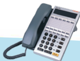
DK6-12S 18K 標準型