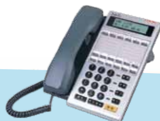
DK6-12DC(BL) 18K 中文背光 DK6-12D(BL) 18K英文背光