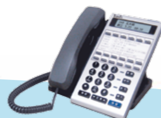
IP37-62A 中文背光 IP Phone