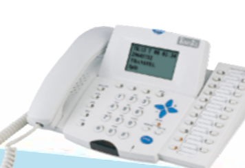
DK2-21(DSS 22) 中文64字元總機電話